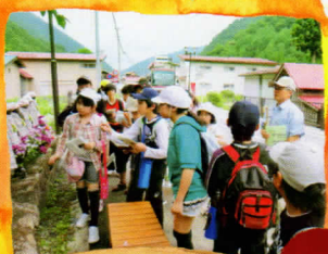
檜枝岐村 散策ツアー

「裁ちそば」はつなぎを使用しないため、そばの香りが豊かです。檜枝岐村の郷土料理「はっとう」と合わせて、檜枝岐村独特の製法を体験して試食しましょう。