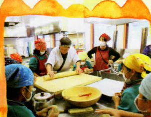
裁ちそば・ はっとう作り体験

江戸時代より続く「檜枝岐歌舞伎」の化粧が体験できます。化粧後には歌舞伎が上演される「檜枝岐の舞台」前で記念撮影できまじり!