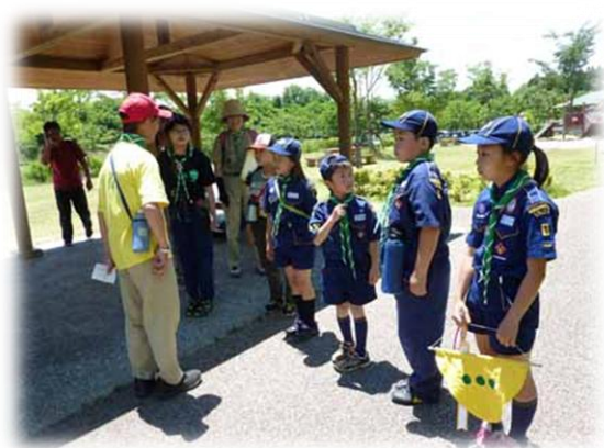
ゴールはもう少し！！

隊長を見つけました！！・・・でもここがゴールではありません。 公園内からゴールの紙を見つけて報告しよう。