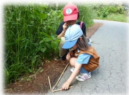
矢印に気付いてくれるかなぁ??