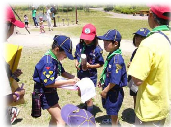
ゴールの紙を見つけました

約1時間45分の冒険も終了しました。 元気に「ごはんの歌」を歌って昼食を食べた 後、隊長・副長から今日の講評をいただき ました。