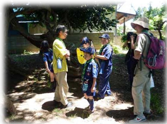
頑張っ歩いてきたね (*_*)