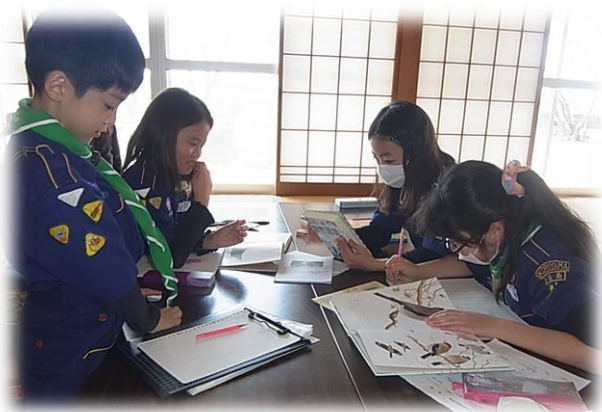
黄組 (3/16 (土) 柴宮公民館)