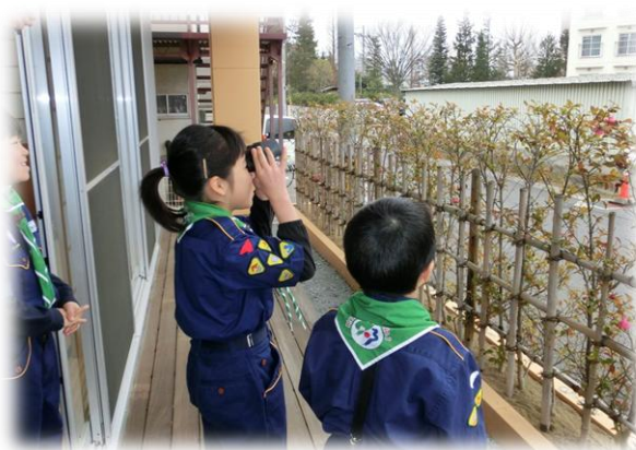
赤組 (3/23 (日) さんかくプラザ)