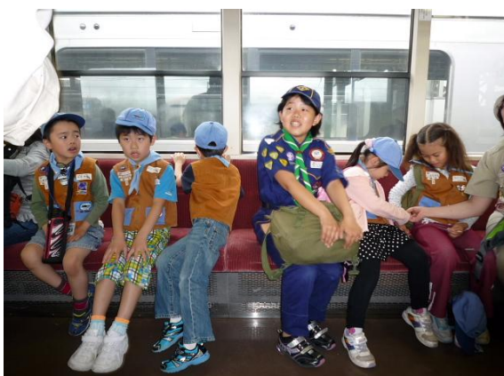
↑ スカウトたちは、行先を知らず 言われるままに郡山発10:01の電車に乗車