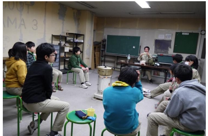
隊長がカバンの中身を説明しながら話し始めると…… いつの間にか始まるキムスゲーム。油断禁物！！