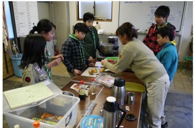
買い出しから戻ったら、さっそく調理開始!! 副長からコツを教えてくださいましたね。

1団 2団 スカウト : 10名 + 2名 父兄 : 0名 + 0名 指導者 : 3名 + 1名 合計 : 16名