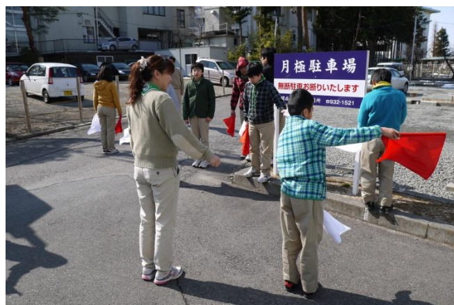
ロープや手旗といった基本訓練もやりました。