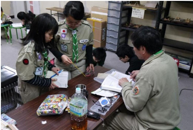
進級審査もやりました。 どんどんやって隊長のサインをもらおう！