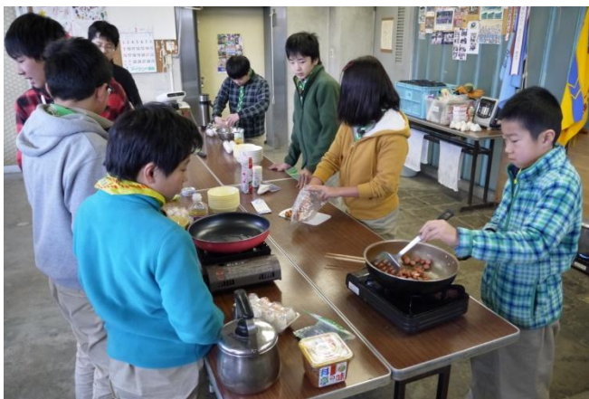
朝食の準備。 手際良くやろう。