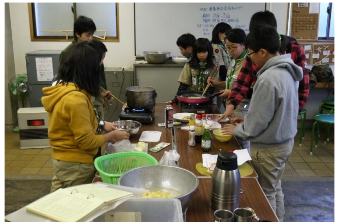
何が出来たのかと言いますと↓