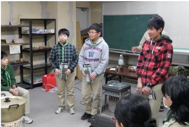
隊長から少し遅めの誕生日プレゼントが。 良かったですね！