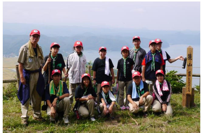
展望台で記念の1枚。