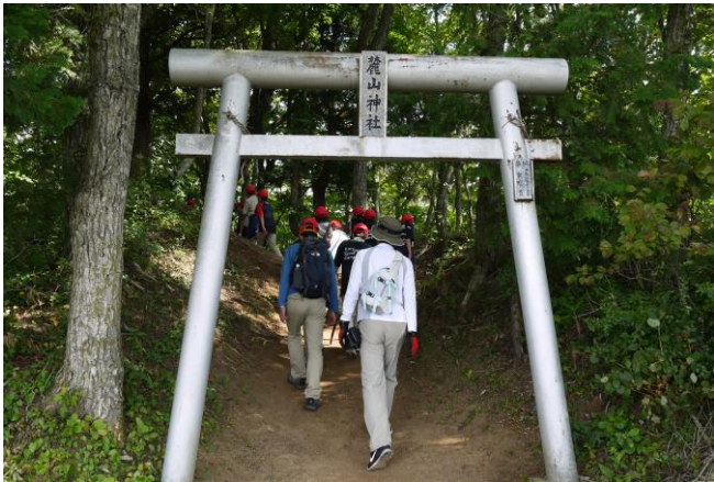
山頂は更に上にありました。