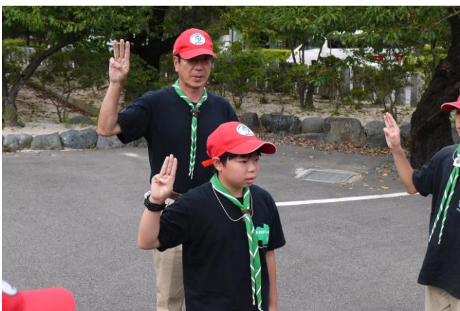
よいスカウトに一