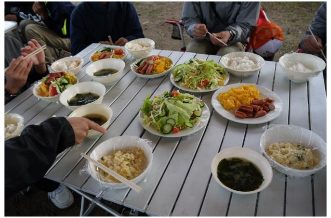
朝食のメニュー。なかなか豪華でしょう？