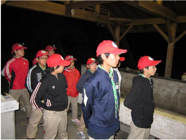
夜は肝試しに行きました。