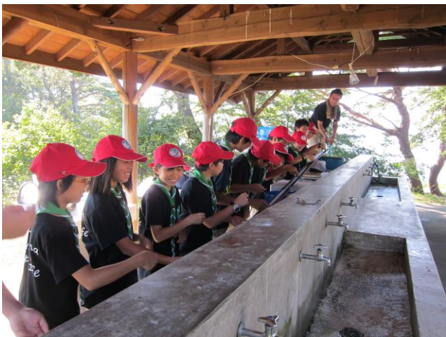
1団ボーイ隊の伝統を受け継ぎ…