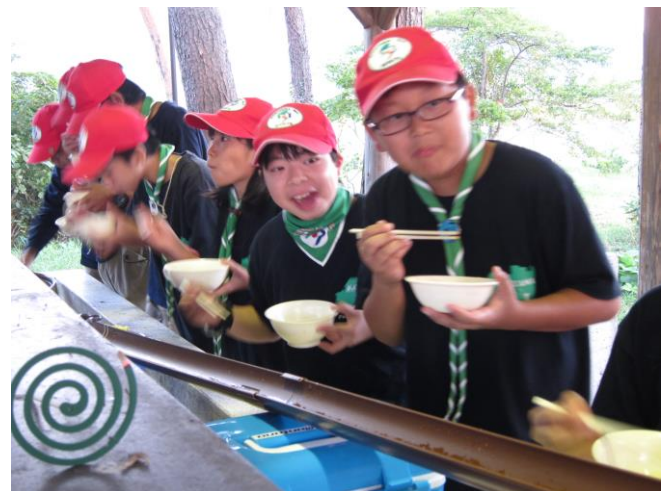
流しそうめん！！ 美味しかったですね。