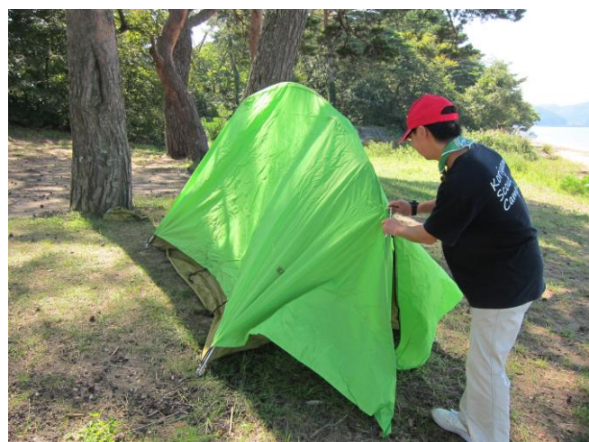
こちらはベンチャーのテント。