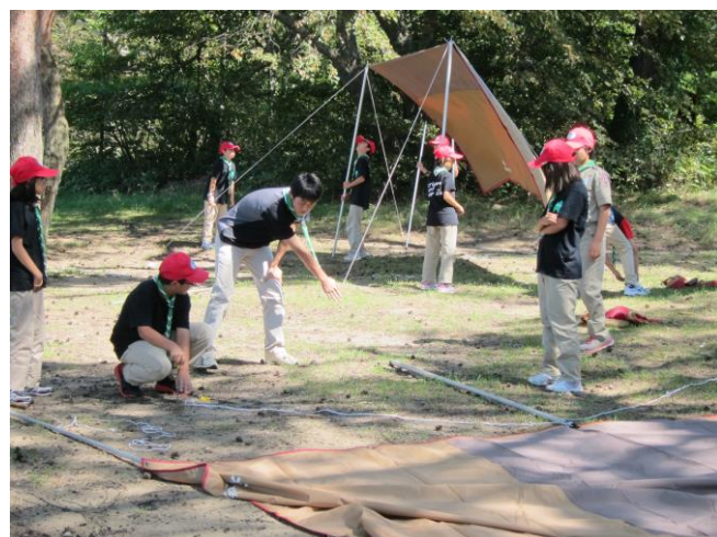
ベンチャーの先輩にアドバイスを貰いながら…