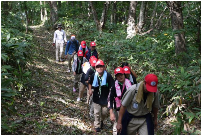
険しい山道を歩き…