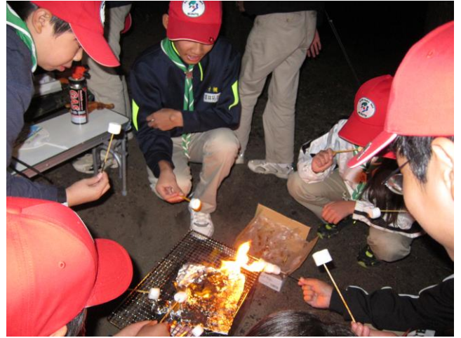
恒例の焼きマシュマロも。