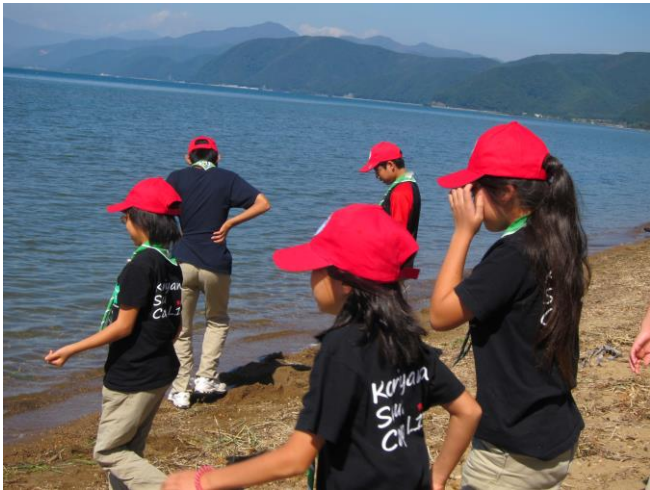
せっかくなので猪苗代湖で遊びました。