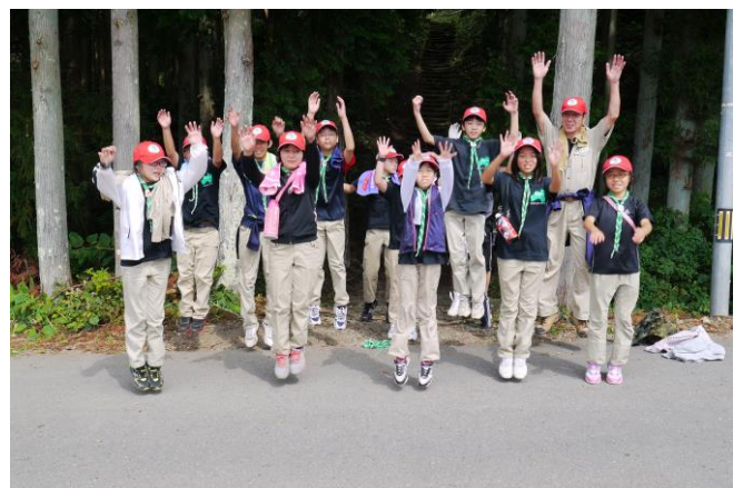
下山。みんなでゴール！