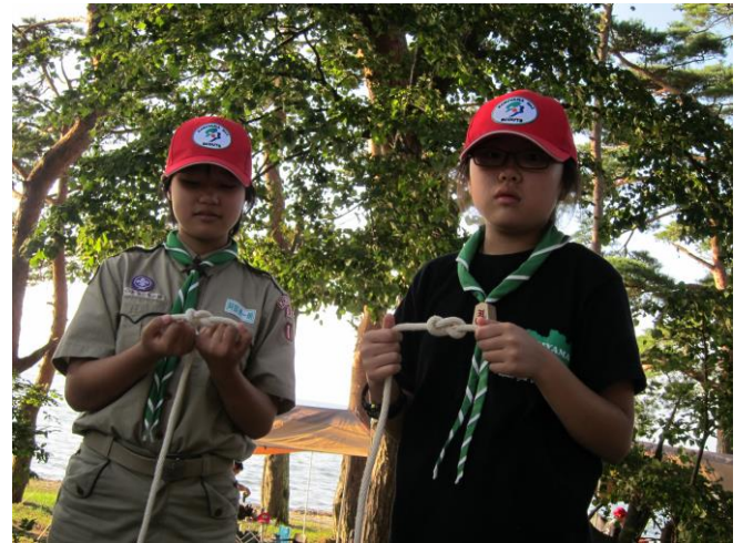
新入スカウトも挑戦しました。