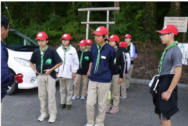
朝食の後はハイキングへ。